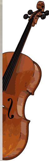
Claudio Santoro. Frevo. 1953 Gênero(s): choro