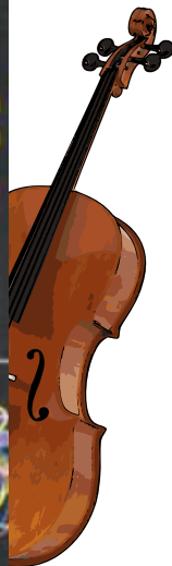
New World Press. Chinese Folksongs. 1984 Gênero(s): música popular chinesa